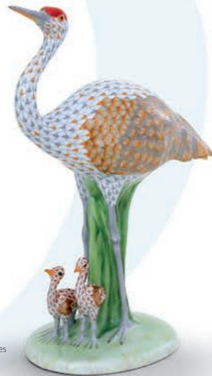
Sandhill Crane with babies Kanadai daru fiókával 16100000VHSP131