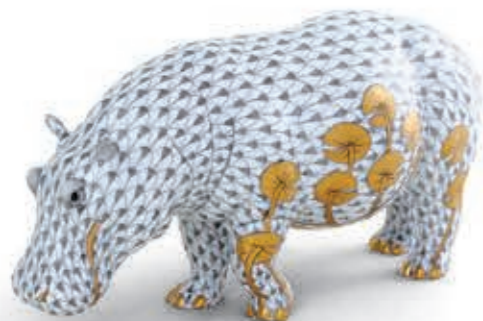
Hippo Víziló 16036000VHSP117