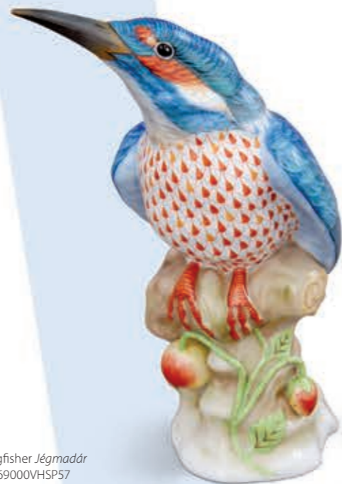
Kingfisher Jégmadár 05169000VHSP57