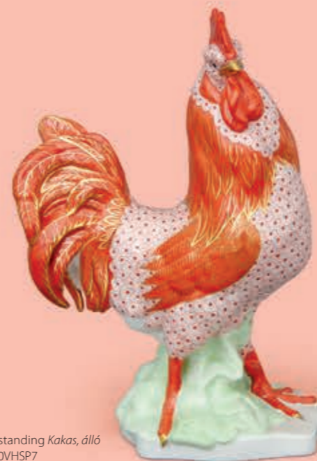
Rooster, standing Kakas, álló 05148000VHSP7