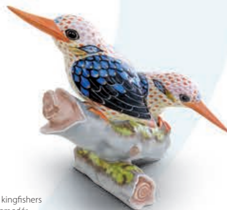
Black-backed kingfishers Fekete hátú jégmadár 16085000VHSP129