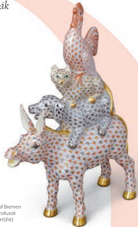
Musicians of Bremen Brémai muzikusok 05524000VHSP43