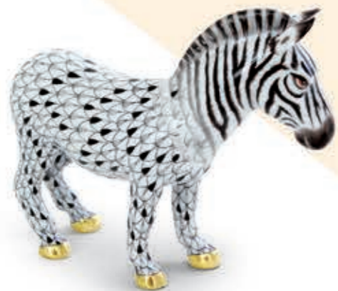
Zebra Zebra 15558000VHSP64