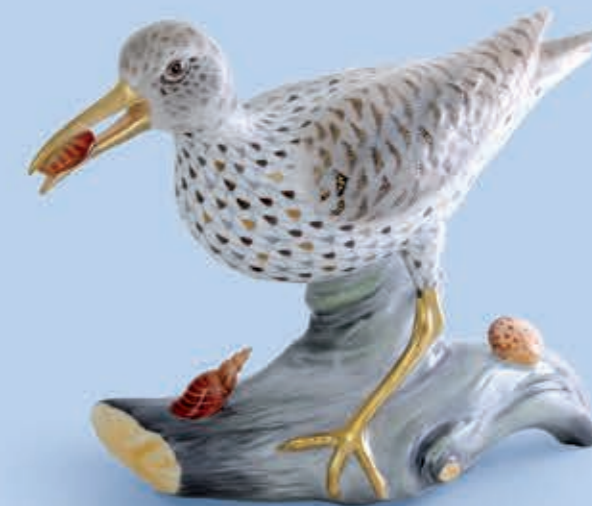
Spotted sandpiper on driftwood Sárjáró libuc 05791000VHSP70