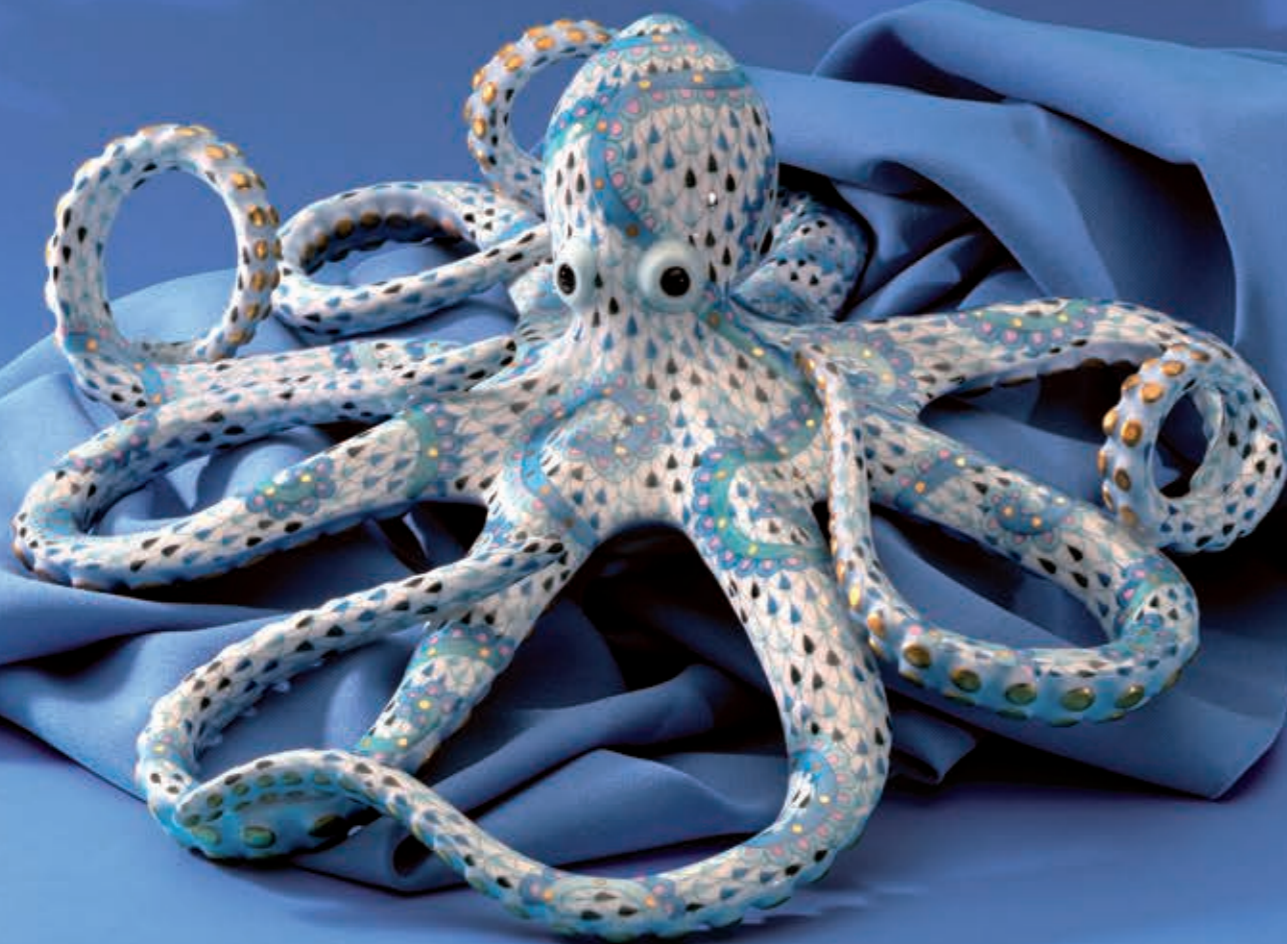
Octopus Polip 16028000VHSP113

A legtitokzatosabb élőlények hazái a tavak, a tengerek és az óceánok.