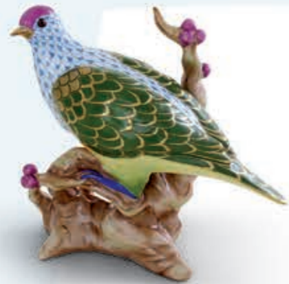
Fruit dove Gyümölcsgalamb 16034000VHSP115