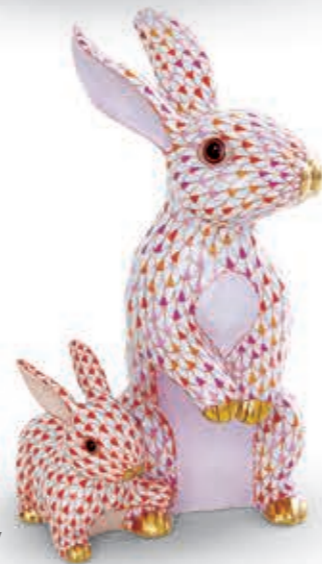
Mother and baby bunny Nyúl kölykével 05911000VHSP93