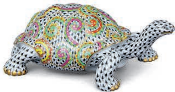
Tortoise Teknősbéka 15972000VHSP20