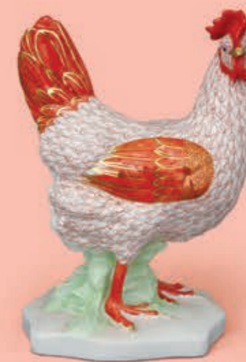
Hen, standing Tyúk, álló 05149000VHSP8