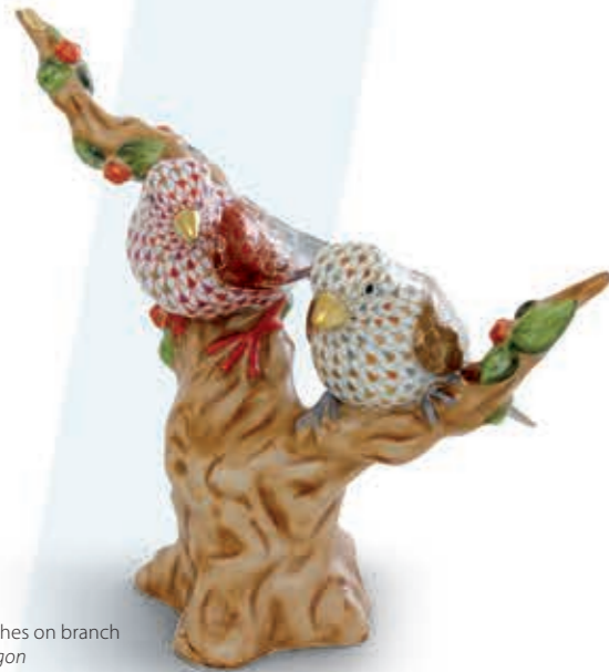
Pair of finches on branch Pintypár ágon 05822000VHSP82