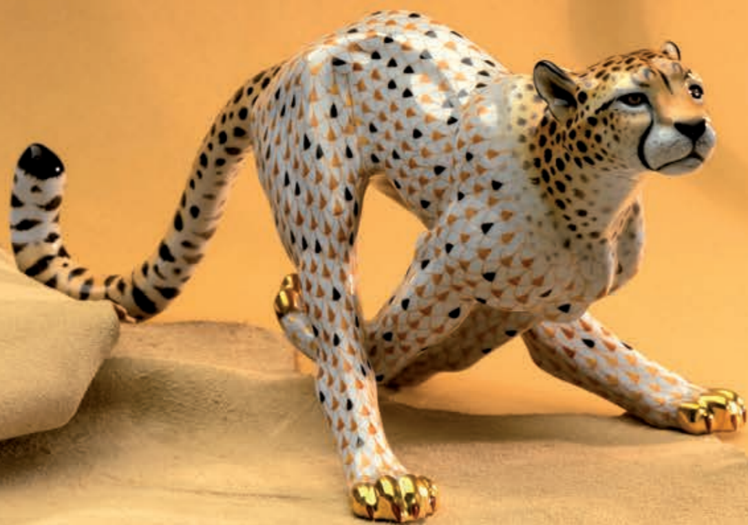
Guepard, big Gepárd, nagy 15656000VHSP32

Forró pusztaság A világ legjobb futóinak és legfenségesebb vadállatainak az otthona.