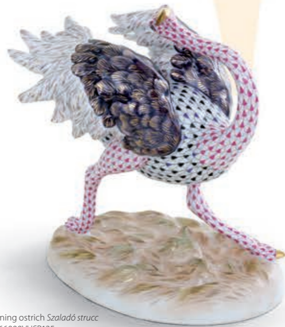
Running ostrich Szaladó strucc 16066000VHSP125