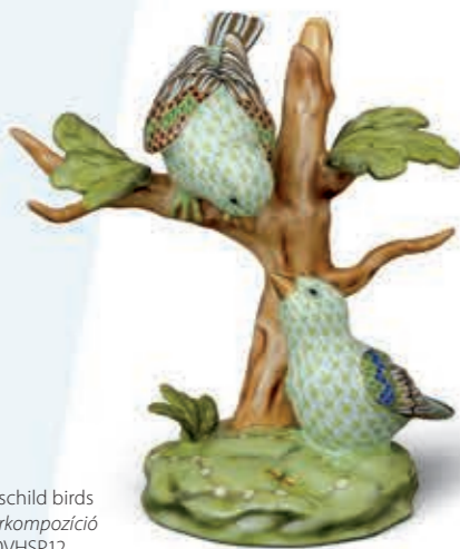
The Rothschild birds RO madárkompozíció 15085000VHSP12