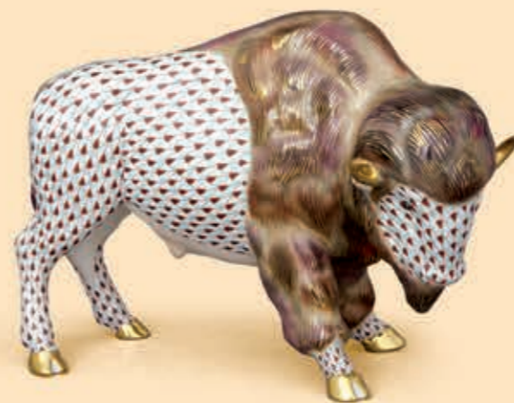
Bison Bölény 15098000VHSP15