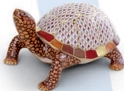
Eastern box turtle Ékszerteknős 16089000VHSP130