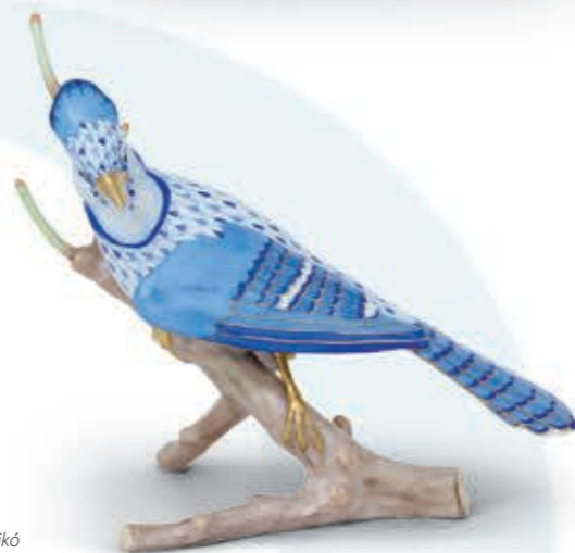
Blue jay Amerikai szajkó 15342000VHSP41