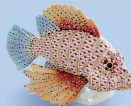
Lionfish Tűzhal 05725000VHSP67