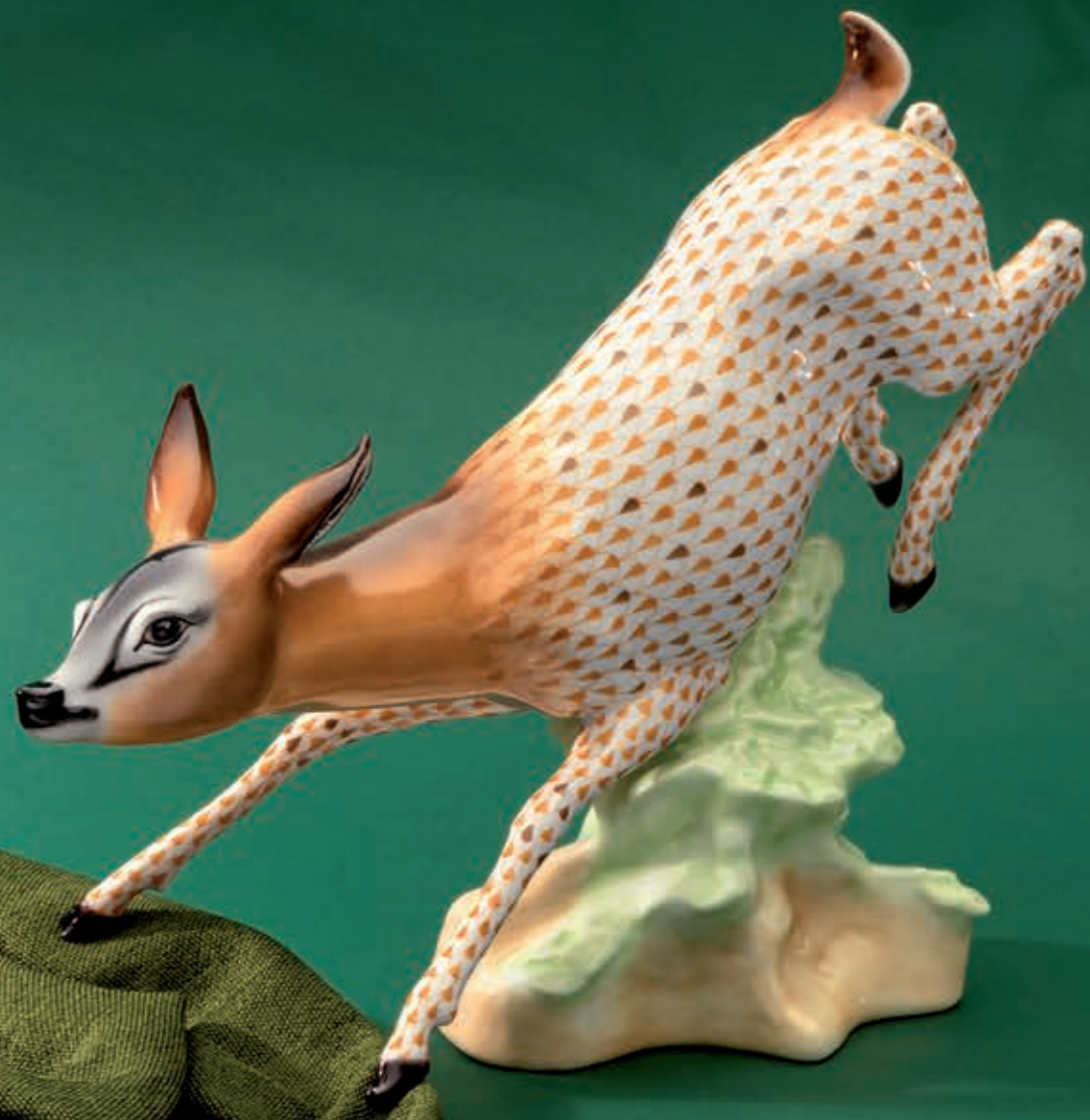
Jumping deer Úgró őz 15261000VHSP79

Az erdő sűrűn lakott terület: az avarszinttől a bokrokon át a fák koronájáig mindenütt találunk élőlényeket.