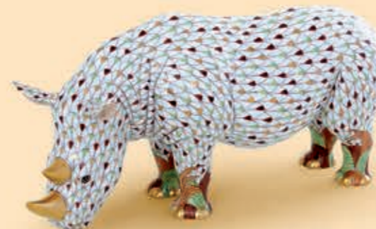
Rhinoceros Orrszarvú 16038000VHSP122