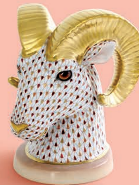
Ram's bust Kosfej 05768000VHSP72