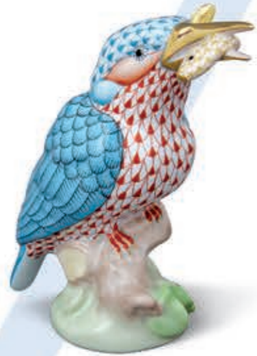
Kingfisher with fish Jégmadár, hallal 05168000VHSP23