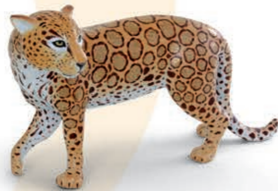
Jaguar Jaguár 16031000VHSP114