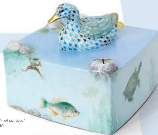
Pond life Tavi jelenet kacsával 05547000VHSP40