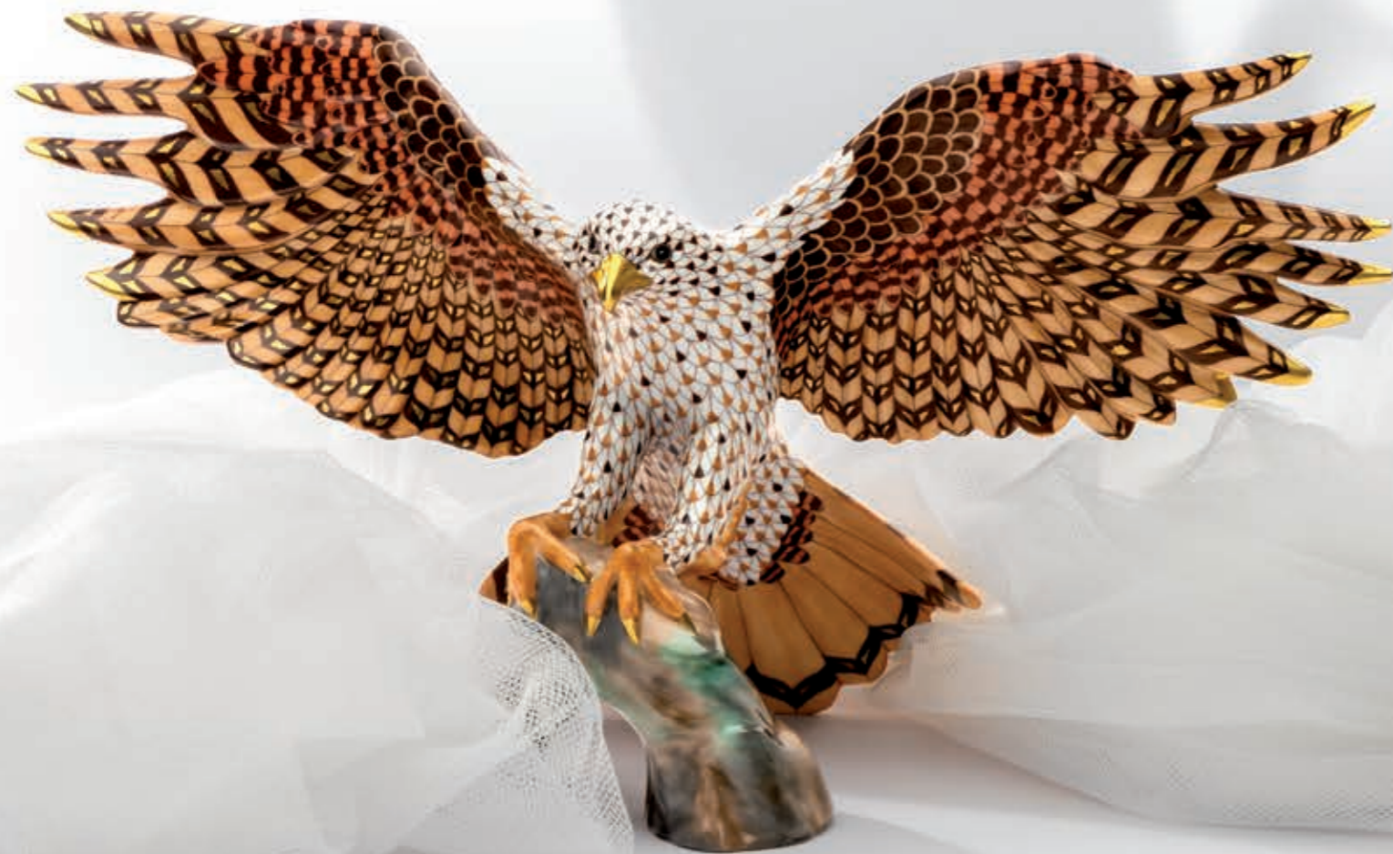
Landing Hawk Leszálló sólyom 05764000VHSP88

Szabadon szárnyalnak és nincs számukra akadály – hát nem irigylésre méltó?