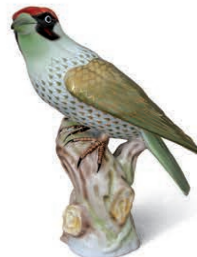
Popinjay Zöld harkály 05075000VHSP53