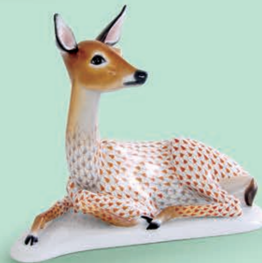
Lying deer Fekvő szarvasűnő 15289000VHSP75