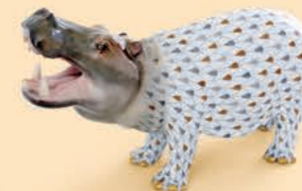
Yawning hippo Víziló, ásitó 15851000VHSP62