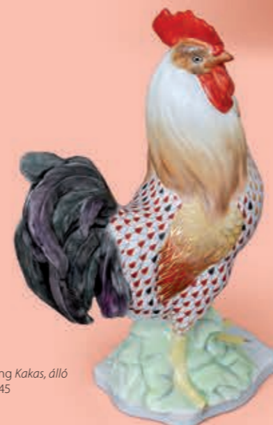
Rooster, standing Kakas, álló 05148000VHSP45