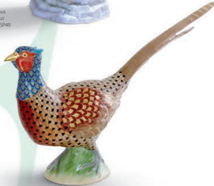
Pheasant rooster Fácánkakas 05908000VHSP94