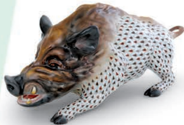
Wildboar Vadkan 05673000VHSP87