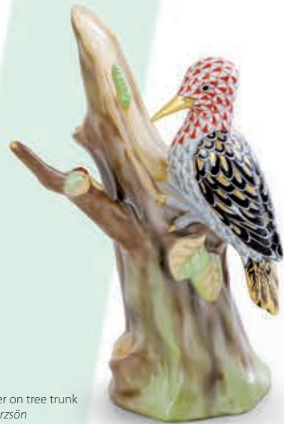
Woodpecker on tree trunk Harkály fatörzsön 05495000VHSP37