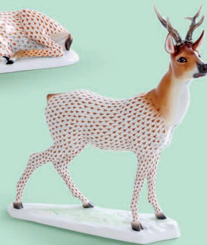
Roebuck Ózbak 15286000VHSP81