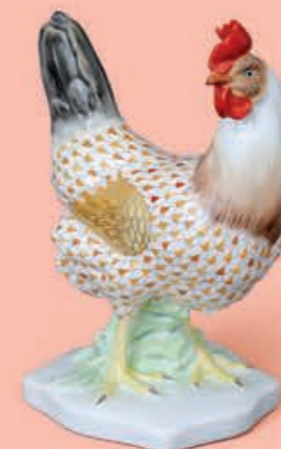
Hen, standing Tyúk, álló 05149000VHSP46