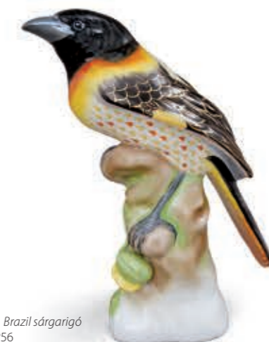
Brazil blackbird Brazil sárgarigó 05064000VHSP56