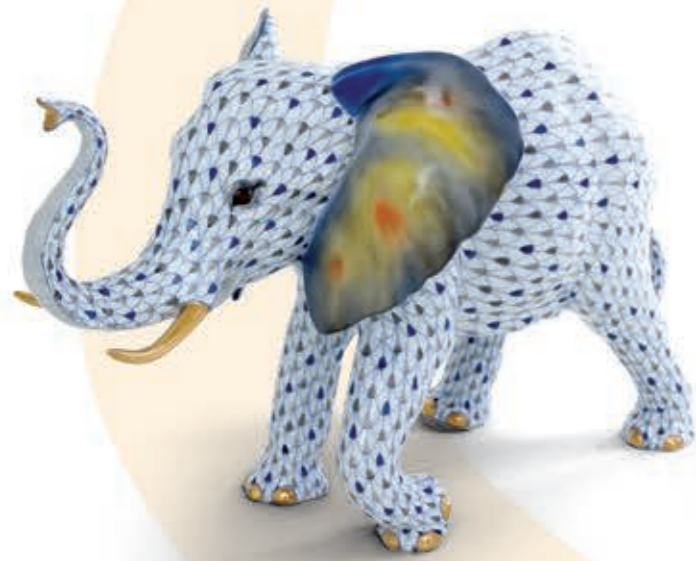
Elephant Elefánt 16053000VHSP124