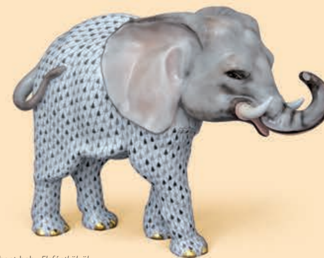
Elephant-baby Elefántkölyök 05214000VHSP26