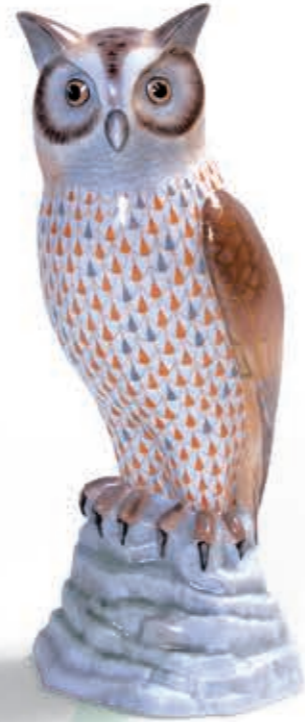
Bubo Maximus Bubo Maximus 15727000VHSP49