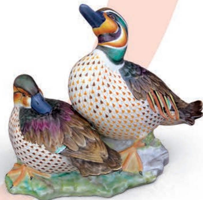
Pair of baical teals Bajkáli bőjti réce pár 15346000VHSP58