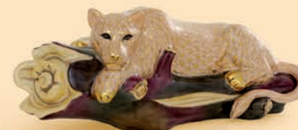
Lioness on tree Fán fekvő oroszlán 05574000VHSP50