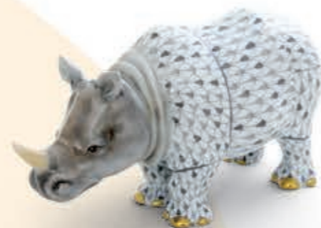
Rhino Orrszarvú 15333000VHSP61