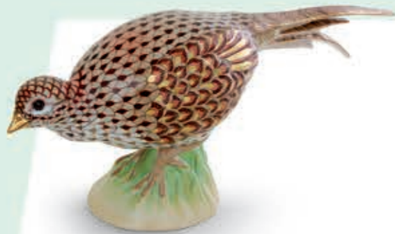
Pheasant hen Fácánytűk 05912000VHSP95