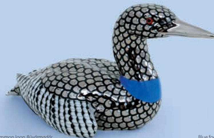
Common loon Búvármadár 15059000VHSP101