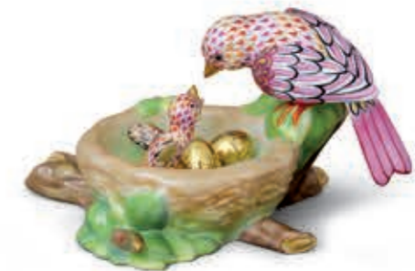
Bird's nest Madarak fészekben 05085000VHSP39