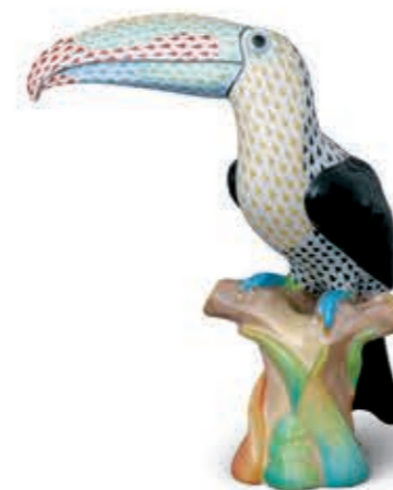
Toucan Tukán 05155000VHSP3