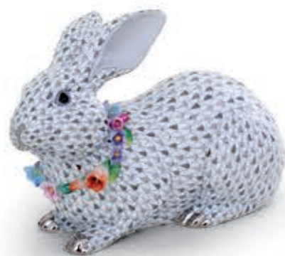
Gray bunny with garland Szürke nyúl virágfüzérrel 16104000VHSP133