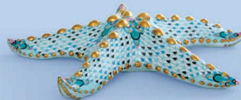
Sea star Tengeri csillag 16105000VHSP132