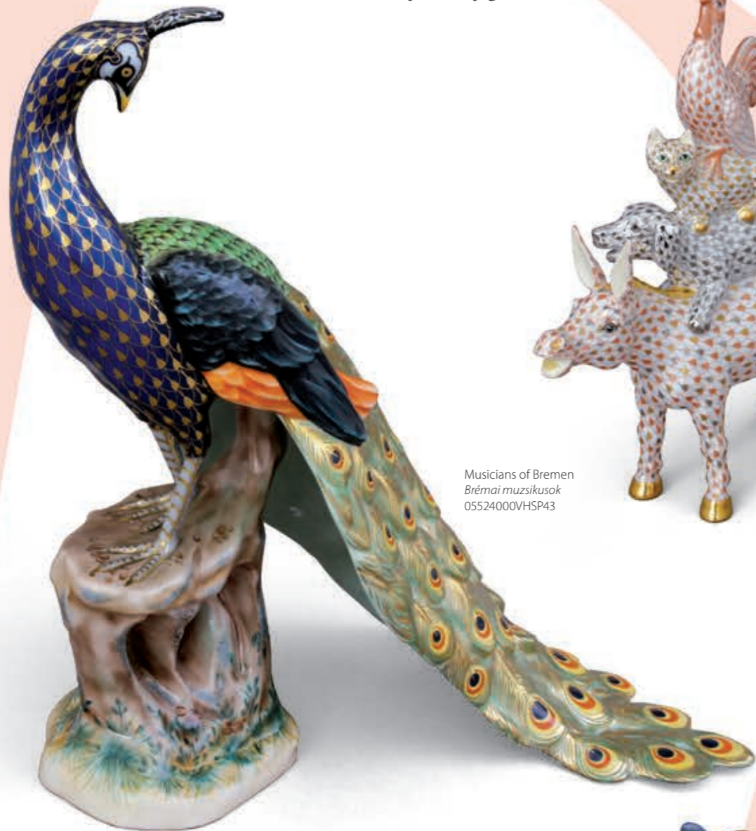
Peacock Páva 05690000VHSP38