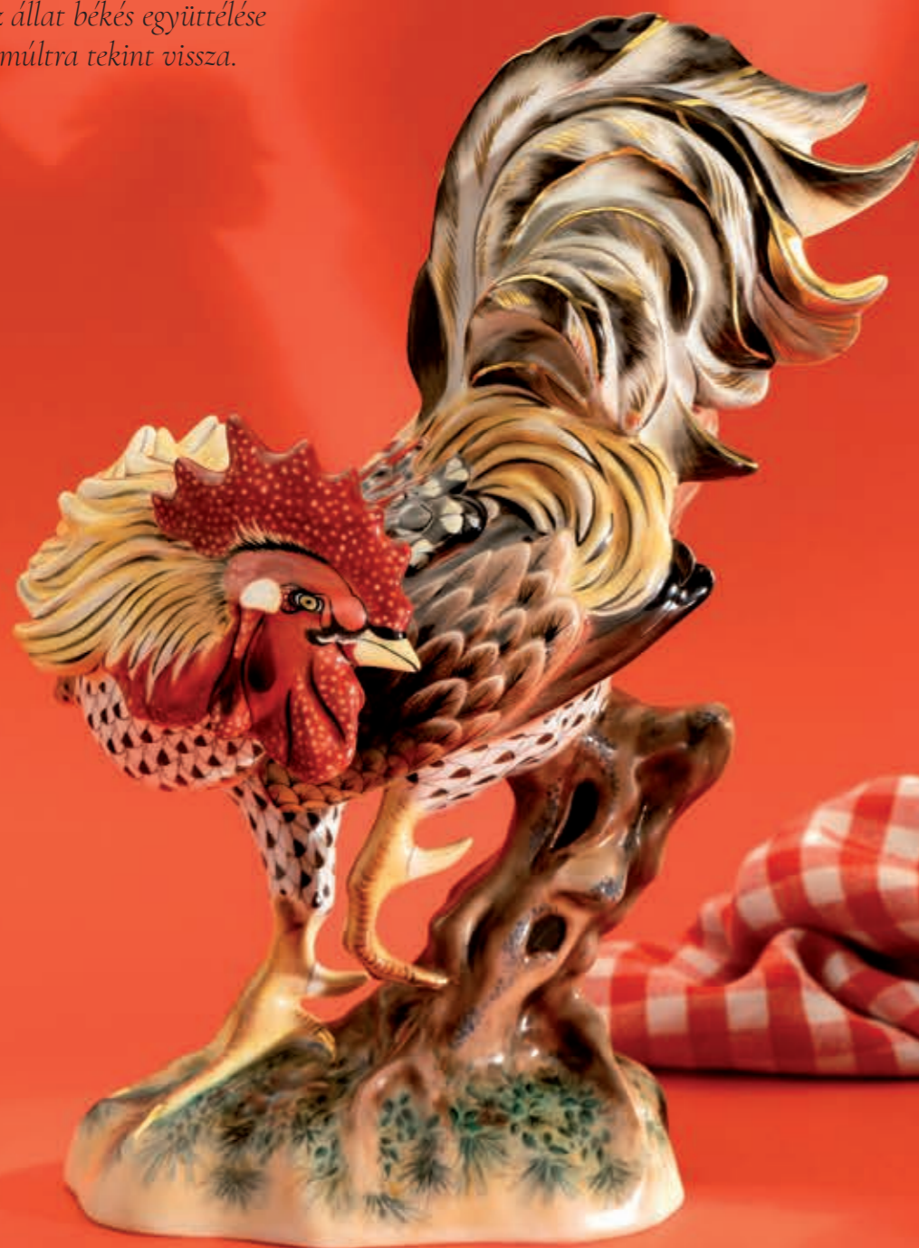
Cock Kakas 05019000VHSP22

Az ember és az állat békés együttélése több ezer éves múltra tekint vissza.