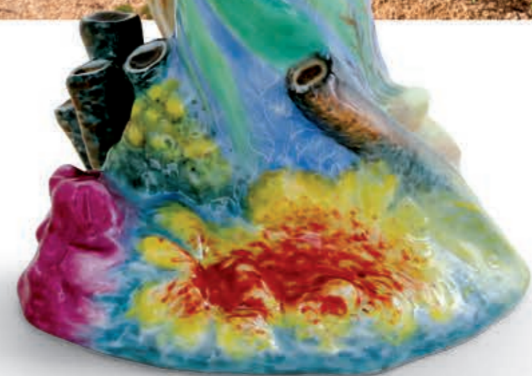
Sea turtle with coral Teknős korallon 15746000VHSP102