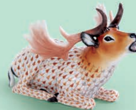
Fallow deer Dámszarvas 15633000VHSP76