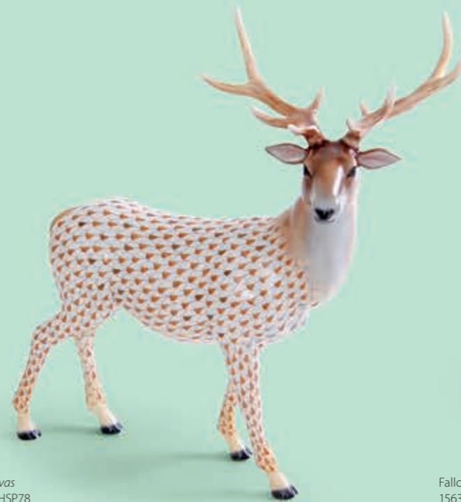
Elk Gímszarvas 05245000VHSP78