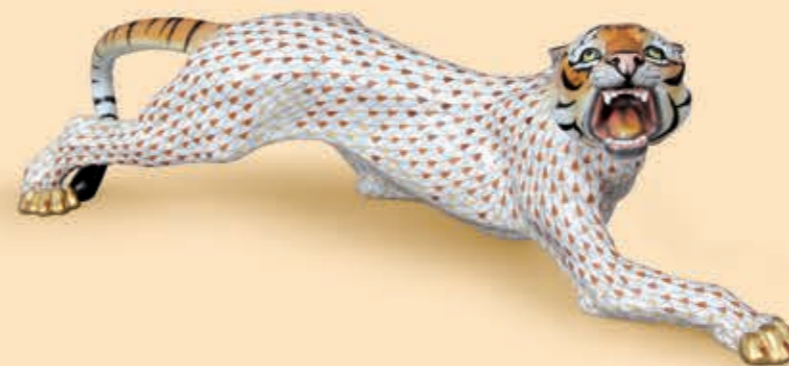
Tiger Tigris 05209000VHSP34