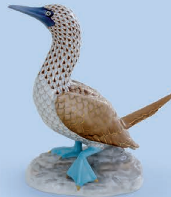
Blue footed booby Kék lábú szula kövön 16014000VHSP108