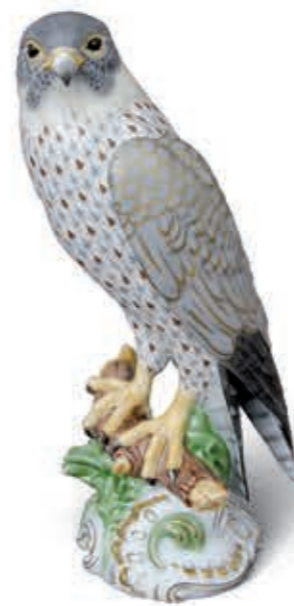
Falcon Sólyom 05151000VHSP54