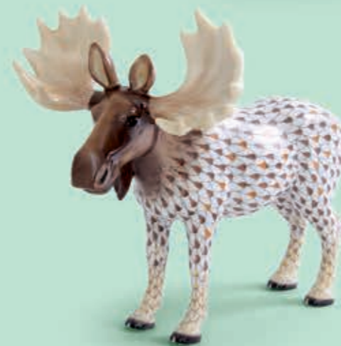
Moose Jávorszarvas 15563000VHSP77