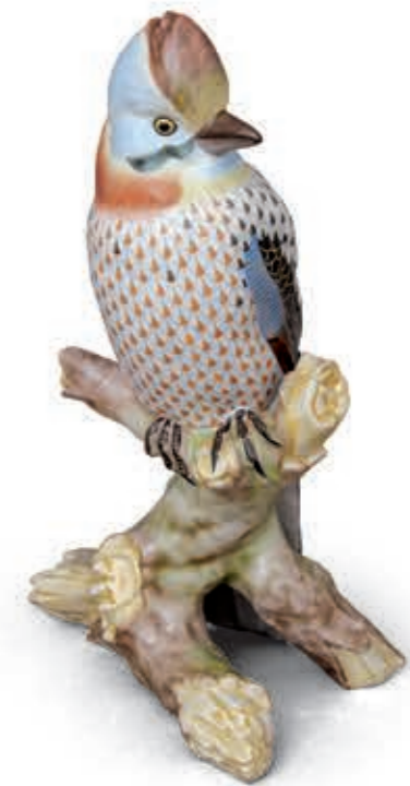
Jay Mátyásmadár 05072000VHSP52